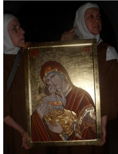
Op bestelling hier geschilderde icon (1,10/0,50 m)