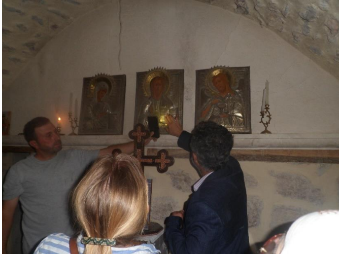
Drie oude Russische iconen met koper bedekt