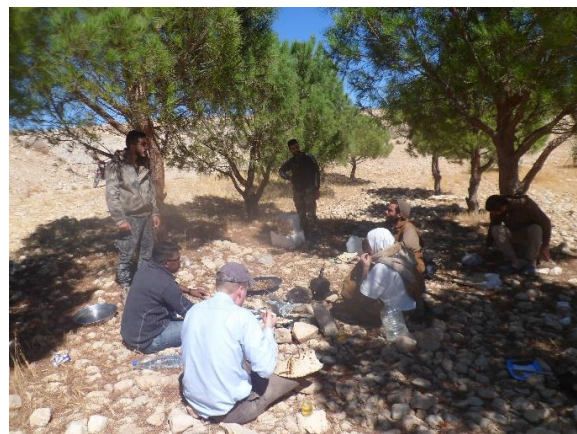
Ontbijt op zondag in de woestijn – eigenaars van het terrein bieden ons druiven aan