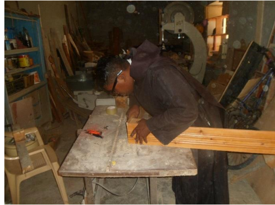
Werken in schrijnwerkerij zonder elektriciteit